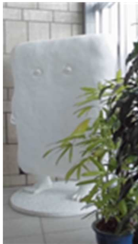
鳥取県庁内の私のお気に入り