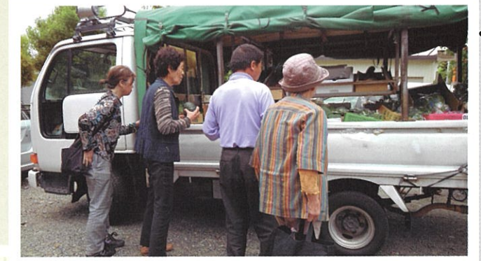
今諏訪・十日市場・浅原 移動販売