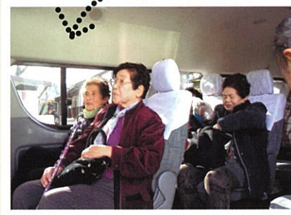
湯沢 買い物ツアー