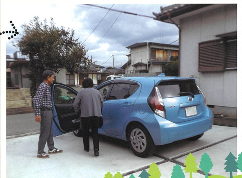
外出支援サービス

平成28年12月に第1層協議体が誕生後、 各小学校区圏域で第2層の協議体が誕生しています。 さらにもっと小さな自治会単位での話し合いも始まっています。 そんな中から各地で様々な活動がうまれています。