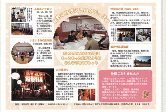
市内各地で製作 支えあいの大切さを地域に伝えるチラシ作り