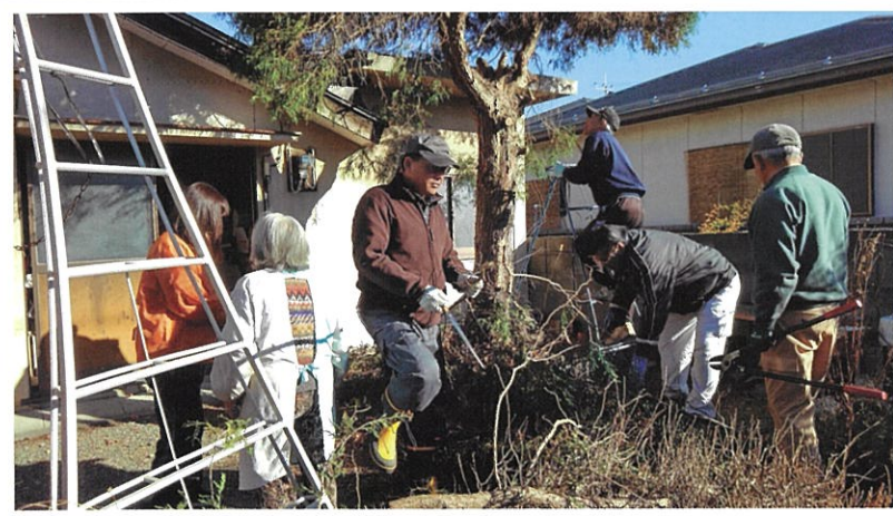
桃の丘 ちっくいサロン