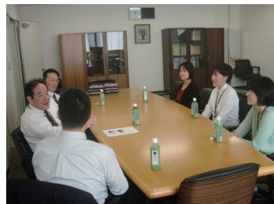
＜局長と若手職員の昼食会後の懇談の様子＞

チームで仕事を行うことも多く、上司と部下との間のコミュニケーションも良好で非常に風通しの良い職場です。 課題に直面しても、一人で抱え込むことなく気軽に相談ができ、先輩職員からのフォローも手厚い環境です。