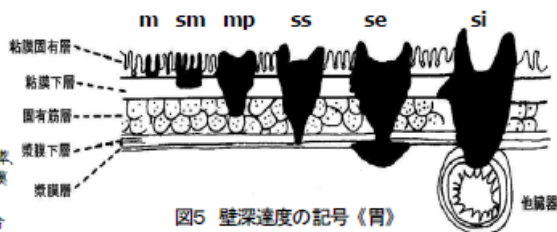
図5 壁深さの記号《胃》