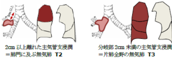
図7 主気管支浸潤のパターン