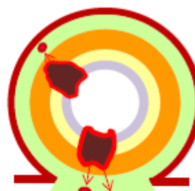
図4 Tumor deposits