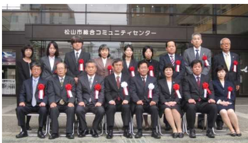
(愛媛県表彰者記念撮影)