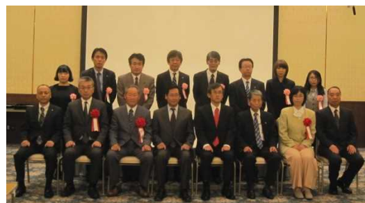
(高知県表彰者記念撮影)