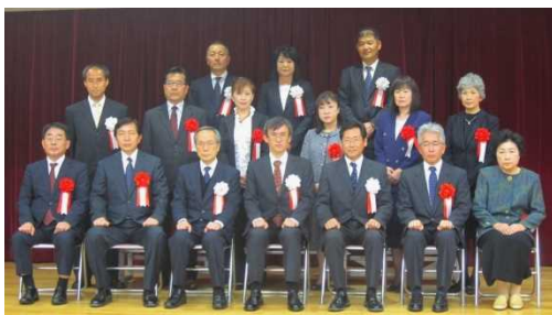
(徳島県表彰者記念撮影)