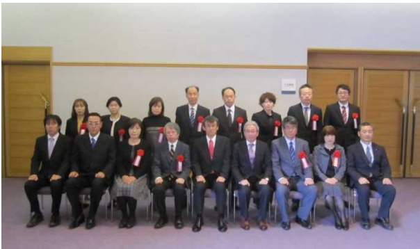
(香川県表彰者記念撮影)