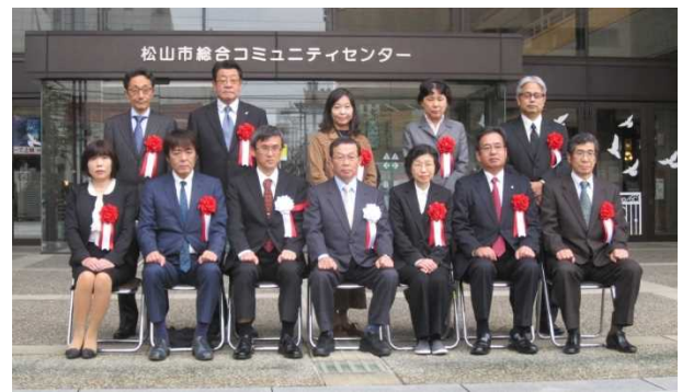
(愛媛県表彰者記念撮影)