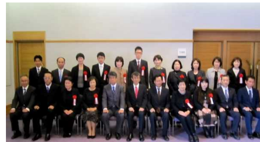
(香川県表彰者記念撮影)