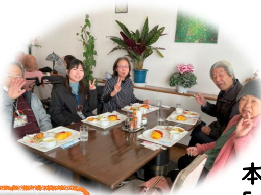
本人ミーティング 「チームあじさい」