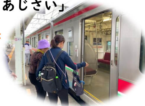
認知症希望大使の活動