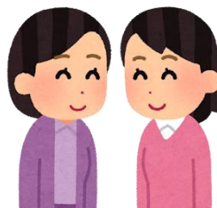
傾聴ボランティア