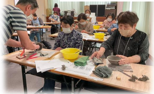
しこちゅ～みんなのカフェ 「あまなつカフェ」