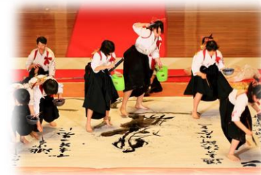
全国高等学校書道パフォーマンス選手権大会