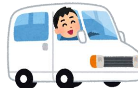
送迎ボランティア