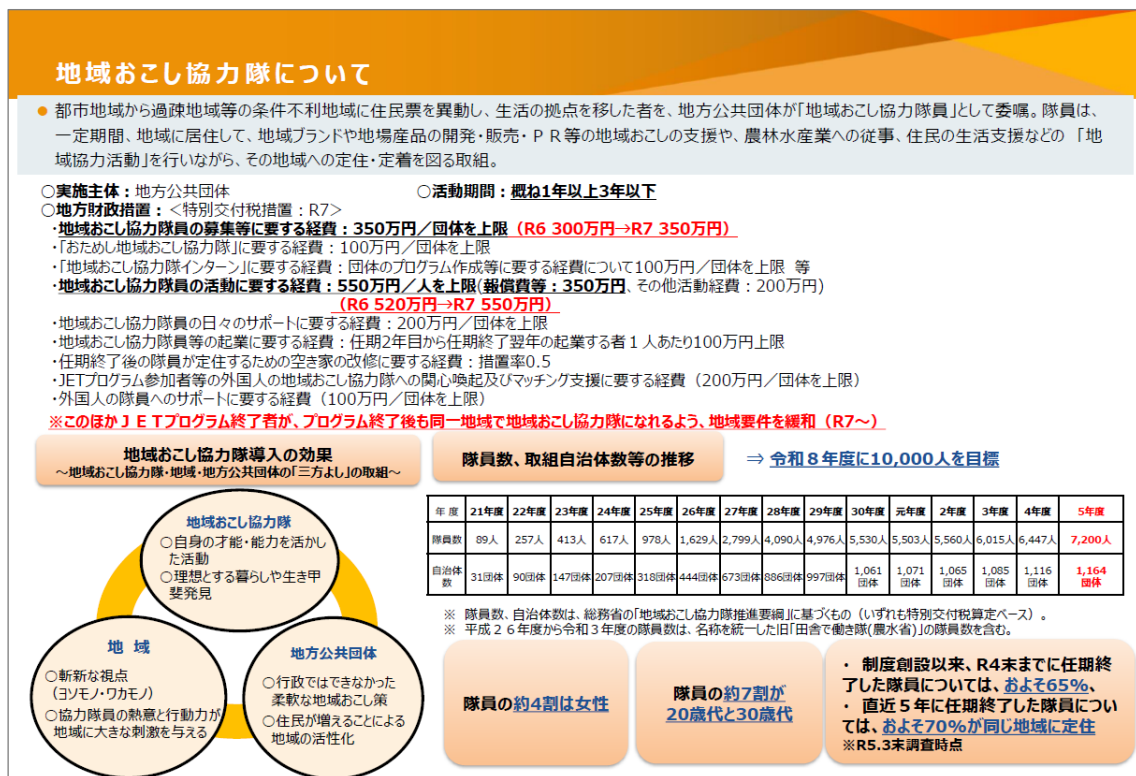
図表 3-16 地域おこし協力隊