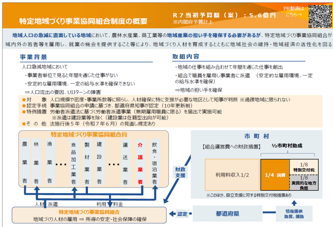
図表 3-17 特定地域づくり事業協同組合