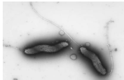
カンピロバクターの電子顕微鏡写真