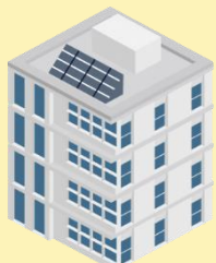
後期高齢者医療広域連合