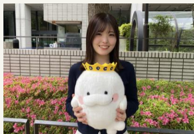
厚生労働省年金局 企業年金・個人年金課