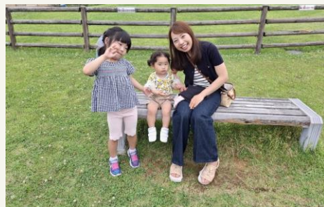
総務年金部門 年金調整課

私は第1子で1年1か月、第2子で1年7か月の育児休業を取得しました。妊娠中は体調不良や健診で休暇を取得することもありましたが、課の皆様にご配慮いただいたおかげで無理なく働くことができました。また、仕事の引継ぎなど育休へ入る準備にも早め早めに協力いただけました。仕事復帰後は課内で業務を調整いただき、育児時間制度や子の看護休暇などを活用できているため、おかげさまで仕事と育児の両立の日々を過ごせています。