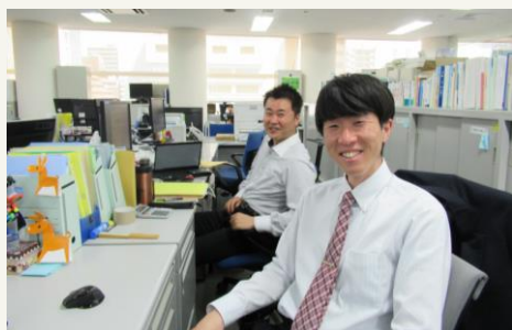
健康福祉部門 地域包括ケア推進課