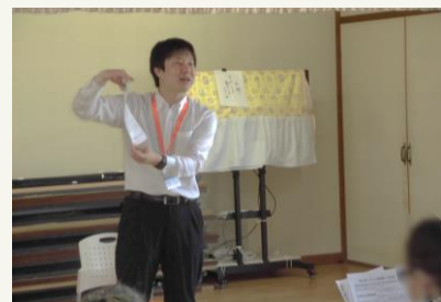
泉大津市 保険福祉部 高齢介護課

所属の長寿推進係では、高齢者福祉の増進や介護予防を所掌しており、ここに書ききれないくらいたくさんの種類の業務をしています。写真は高齢者対象の体操の場で、利用いただける制度やサービスを紹介しています。