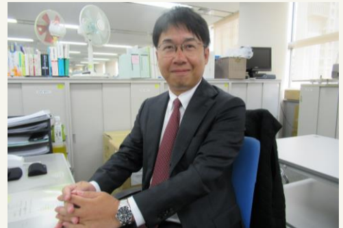
健康福祉部門 医事課

課長補佐として、組織の成果に貢献できた瞬間に大きなやりがいを感じます。多様な業務を通して自身の視野を広げ、新たな知識やスキルを習得することも魅力です。フレックスタイム制度やテレワークなど、多様な働き方を支援する制度が整備されており、自身の専門性を深めながらキャリアアップを目指せる環境です。仕事とプライベートの両立を支援する体制が整っているため、安心して長く活躍できます。