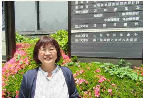
総務年金部門 年金指導課