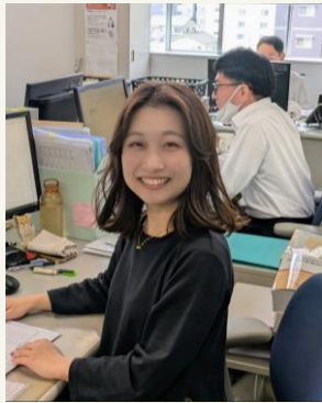
指導部門 滋賀事務所