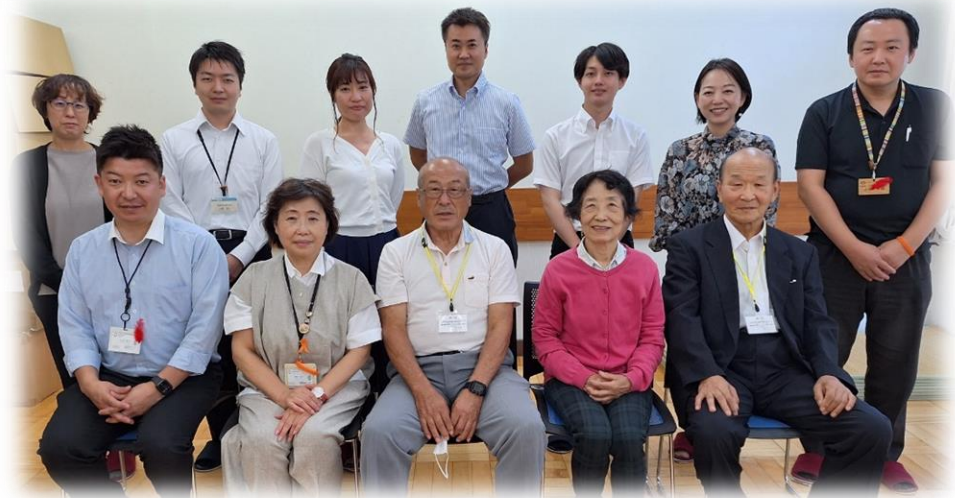
視察の最後にみんなで写真を撮りました (東桜谷おしゃべり会、日野町社会福祉協議会、日野町、滋賀県、近畿厚生局)