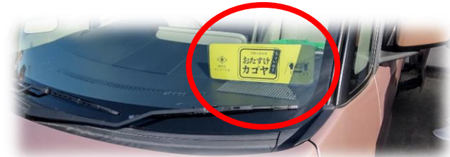
車両の前後にステッカーを置いています