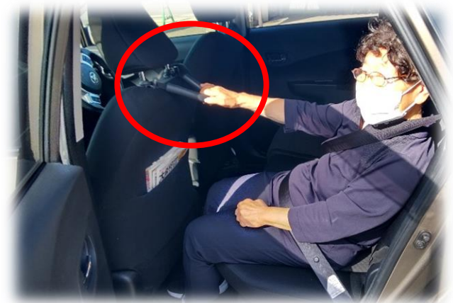
安全のために手すりを付けています