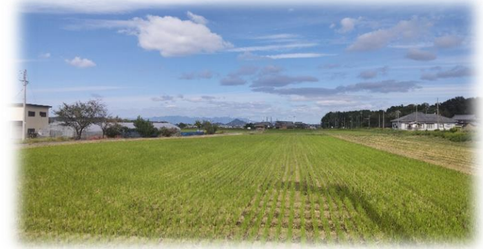
滋賀県日野町はのどかな田園風景が続く農村地域です