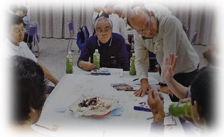
「東桜谷おしゃべり会」の会議の様子