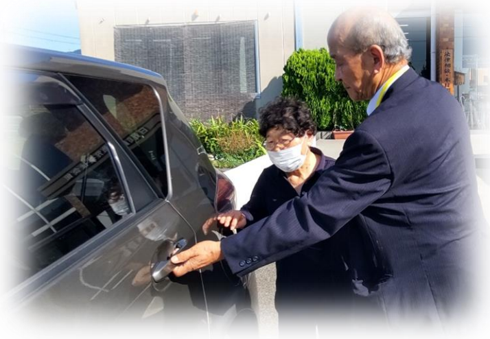
利用者の乗り降りを手伝うドライバー