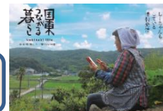
●全国へ周知啓発 ポスターセッション