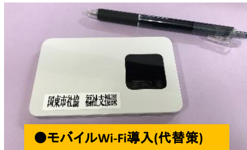
●モバイルWi-Fi導入(代替策)