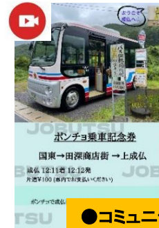
●コミュニティバスの活用