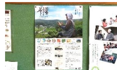
●国東市内へ周知啓発 100部 掲示