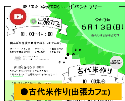
●古代米作り(出張カフェ)