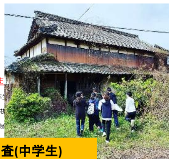
●空き家調査(中学生)

この度、熊毛地区の子供たち(現国見中学校1年生、4月より2年生の地域を回る)となりました。 国東市はご存じの通り人口が減少し、移住定住に向けて市を悩ます。 その一環として「空き家バンク」制度を創設しておりますが、近年物現状を把握しきれないといった問題も抱えております。 そのため、市よりくまげえんあいの活動といえ、大輪も少ない役員、スタッフの状況です。 そこで、これを機に大輪より熊毛地区の子供たちが空き家調査(こま)