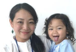
【氏名】 熊田さん と娘さん