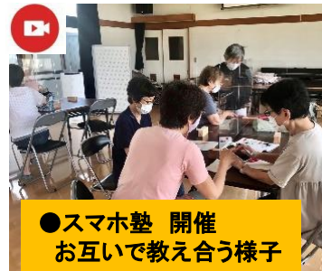
●スマホ塾 開催 お互いで教え合う様子