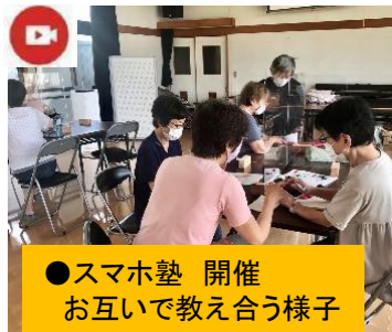
●スマホ塾 開催 お互いで教え合う様子