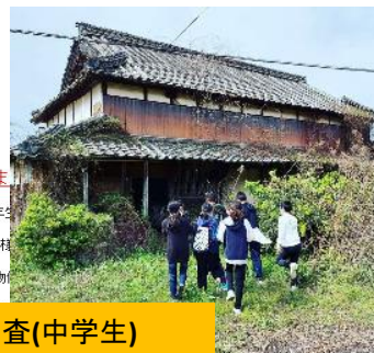
●空き家調査(中学生)