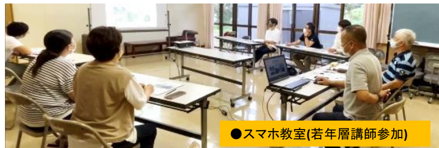
●スマホ教室(若年層講師参加)