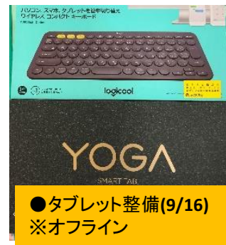
●タブレット整備(9/16) ※オフライン