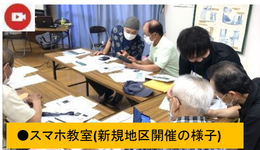
●スマホ教室(新規地区開催の様子)