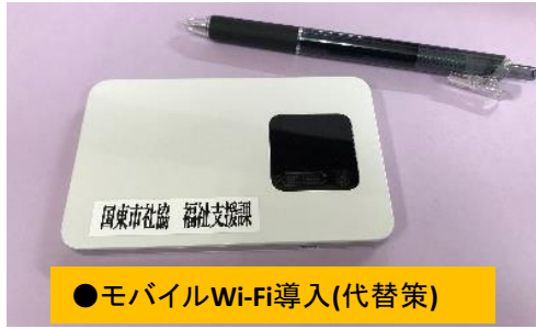
●モバイルWi-Fi導入(代替策)