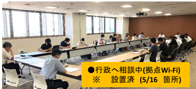
●行政へ相談中(拠点Wi-Fi) ※ 設置済 (5/16 箇所)