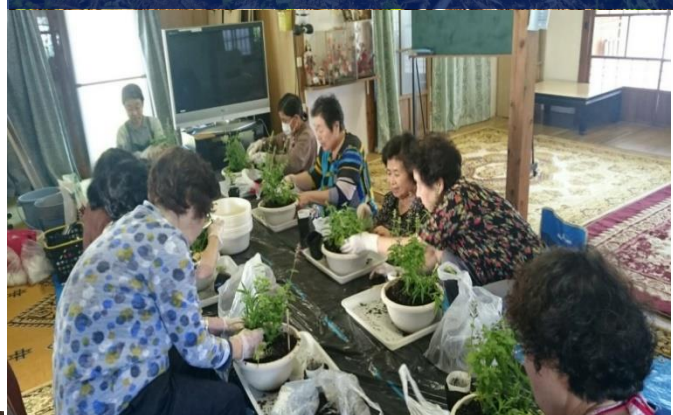
畑がない市街地では、プランターを活用