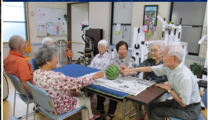
収穫の喜び 通学の児童や住民も生長を見守っています。