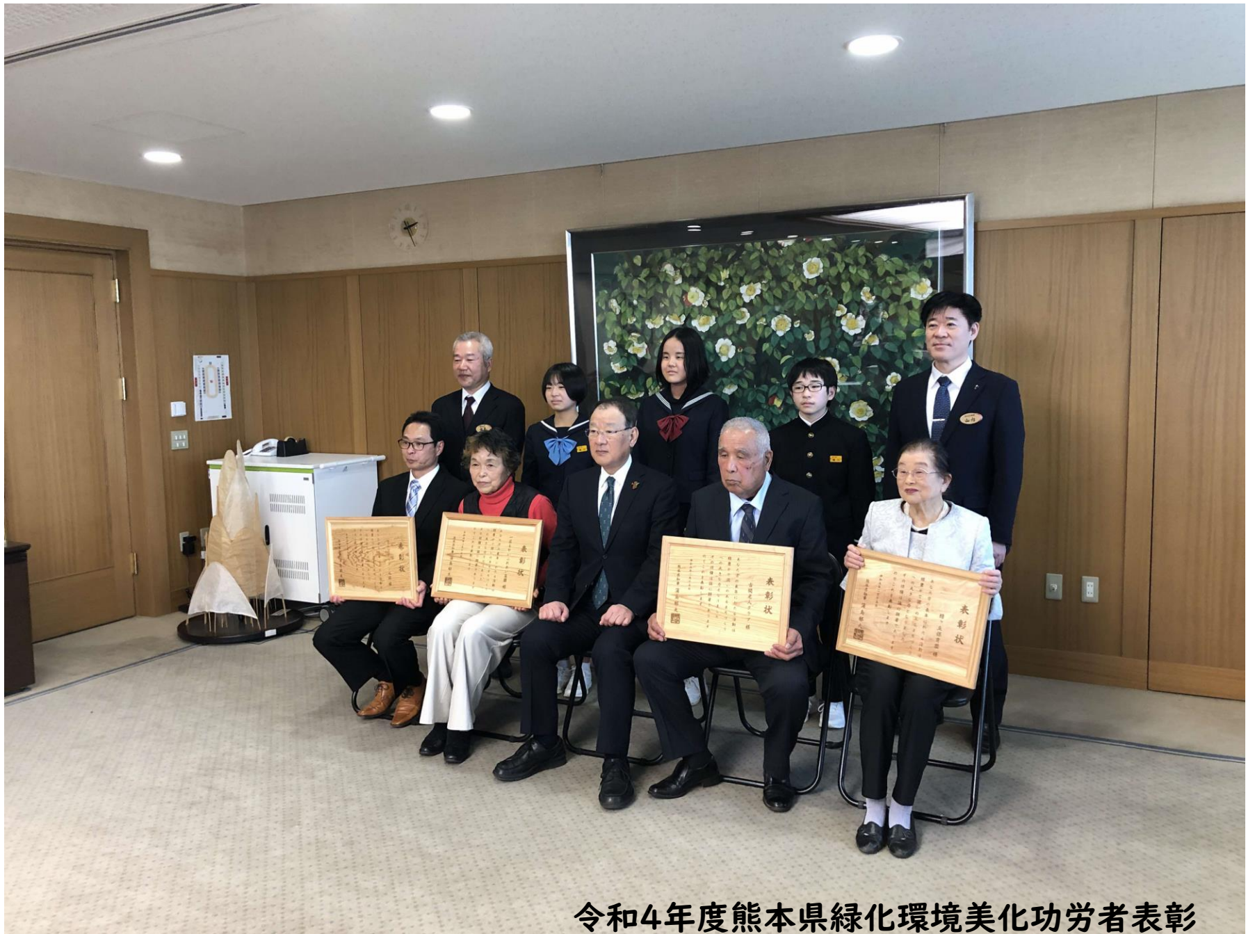
令和4年度熊本県緑化環境美化功労者表彰