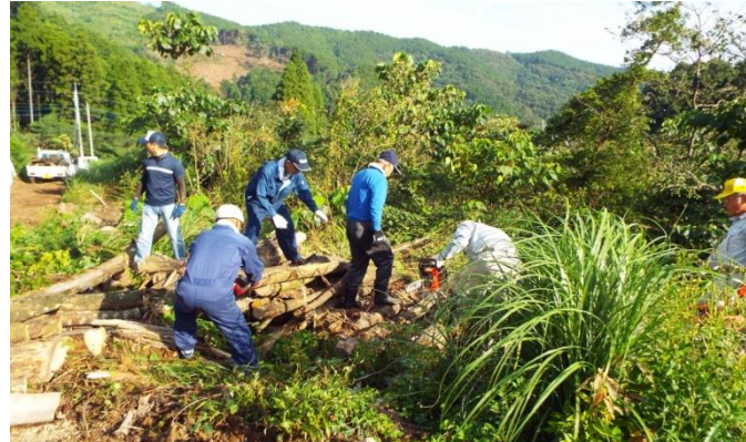
山間部では地域の草刈りと合わせて、しいたけ栽培の準備