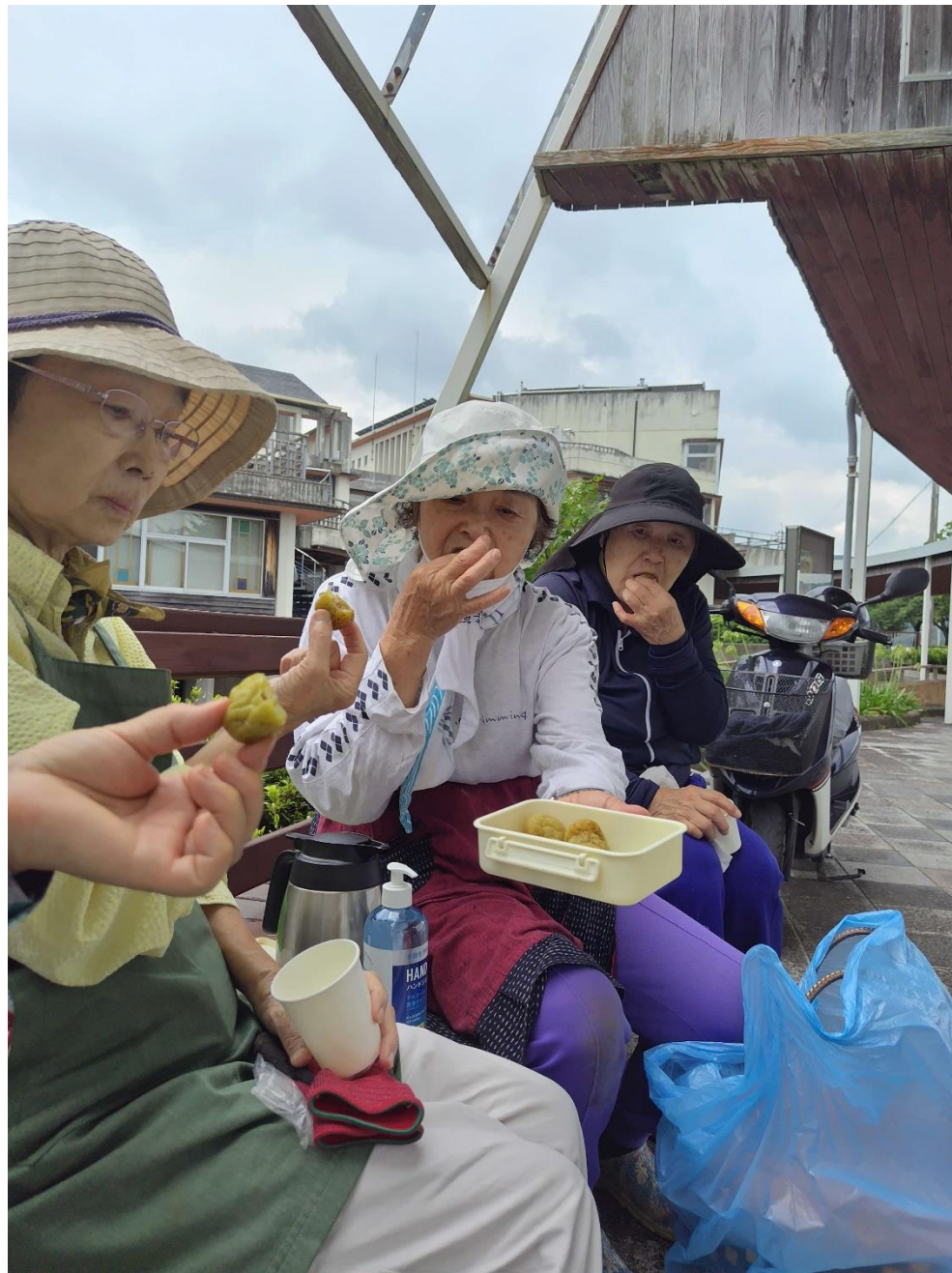
作業後のおしゃべり休憩が楽しみなのよ～