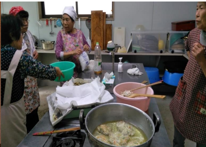
菜園の作物を使い、会食や配食をします。料理をする人、畑作業をする人、おいしく食べる人。それぞれができることを楽しみます。