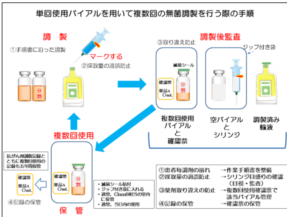
図 2 安全な無菌調製を確保するために最低限必要な手順(例示)