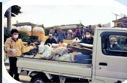
リサイクルセンター