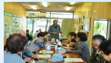
タブレット講習会