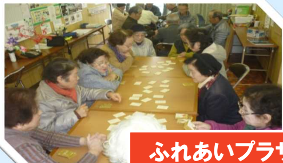
ふれあいプラザ（カラオケ・麻雀・ゲーム）