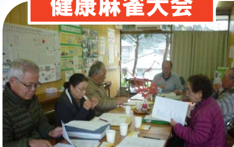
ウエルネスホーム研究