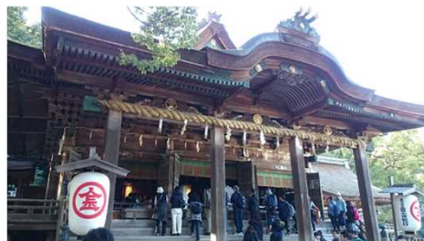
金刀比羅宮(香川県)