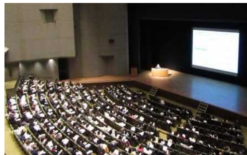
(写真) 診療報酬改定説明会

新規に開設した保険医療機関の開設者・管理者等を対象として、保険診療のルールについて集団指導を行っています。