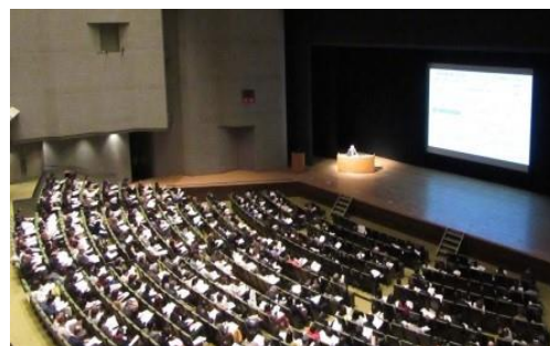
(写真) 診療報酬改定説明会

新規に開設した保険医療機関の開設者・管理者等を対象として、保険診療のルールについて集団指導を行っています。