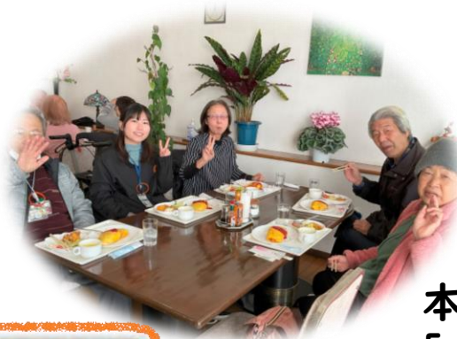
本人ミーティング 「チームあじさい」