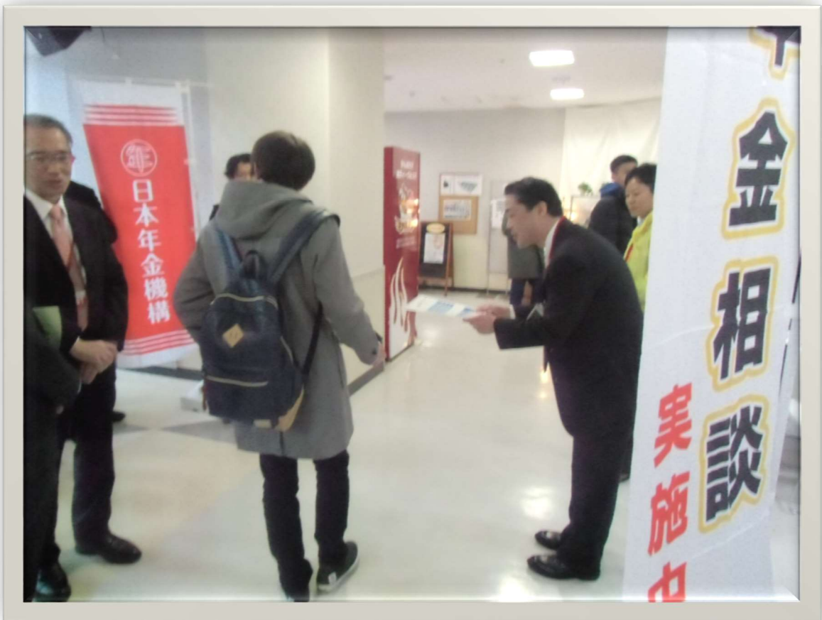
年金制度周知活動