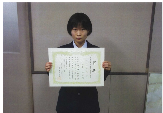
東北厚生局長賞受賞者の記念撮影