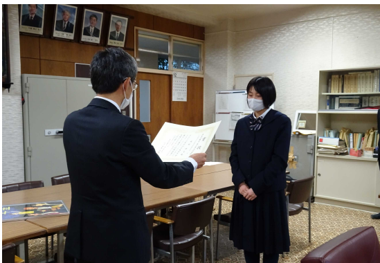
東北厚生局長賞の授与式

令和4年12月13日、仙台市立仙台青陵中等教育学校において、厚生労働省東北厚生局長賞授与式を行いました。