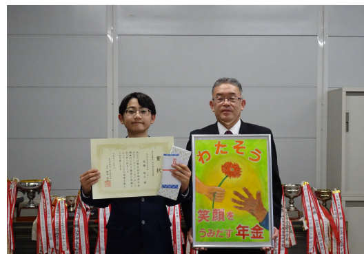
東北厚生局長賞受賞者の記念撮影