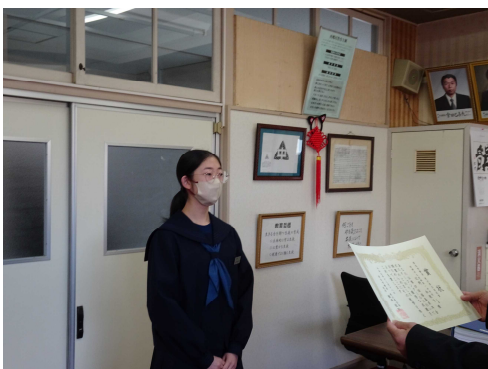
東北厚生局長賞の授与式

令和5年12月27日、西郷村立西郷第一中学校において、厚生労働省東北厚生局長賞授与式を行いました。