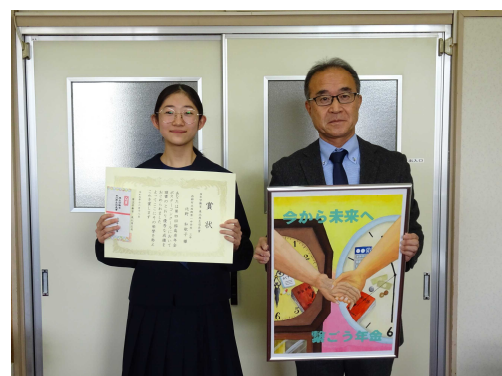
東北厚生局長賞受賞者の記念撮影