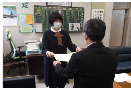
東北厚生局長賞の授与式