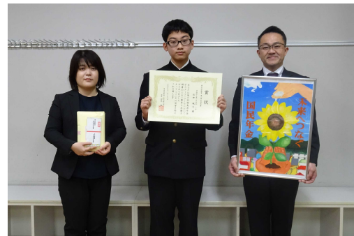
東北厚生局長賞受賞者の記念撮影