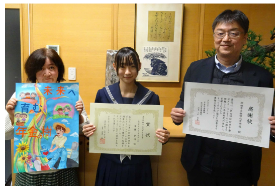
東北厚生局長賞受賞者の記念撮影