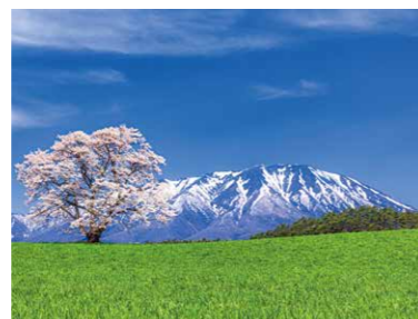
岩手県【小岩井農場の一本桜】