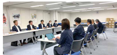
福島復興局との意見交換

東日本大震災による被災自治体や関係機関等を視察・訪問し、復興の現状や課題について意見交換を行っています。