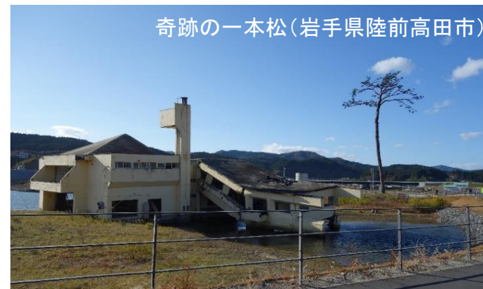
奇跡の一本松(岩手県陸前高田市)

・東日本大震災によって被災した自治体等を視察・訪問し、首長や関係者と復興の現状や課題について意見交換を行うとともに、厚生労働省本省に報告しました。