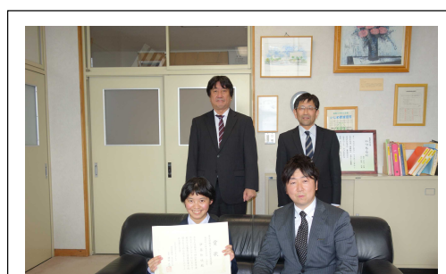
東北厚生局長賞受賞者との記念撮影