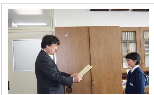
東北厚生局長賞の授与式

11月27日、「厚生労働省東北厚生局長賞」（右の作品）受賞者が通う飯豊町立飯豊中学校において、厚生労働省東北厚生局長賞授与式を行いました。