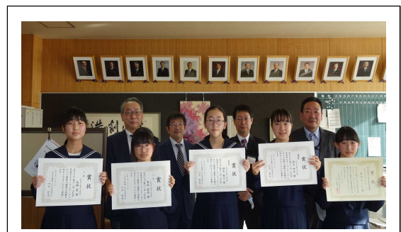
東北厚生局長賞・優秀賞・入選受賞者との記念撮影