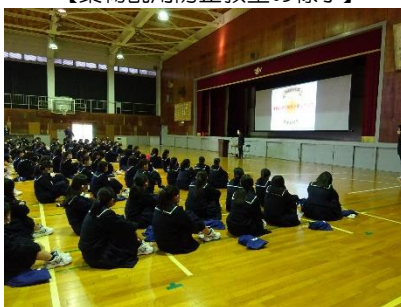
【薬物乱用防止教室の様子】

イ. 11月、三重県津市において麻薬・覚醒剤乱用防止運動三重大会を開催し、薬物乱用防止功労者表彰や、県内の大学生による薬物乱用撲滅宣言、薬物乱用防止対策に関する講演等を行う予定でしたが、新型コロナウイルス感染症感染拡大防止のため中止となりました。