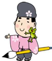
地域包括支援センター